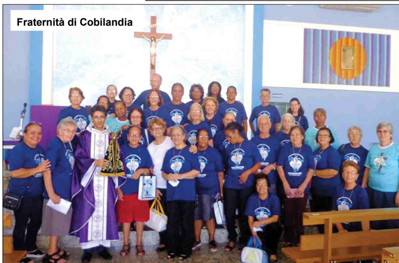
Fraternità di Cobilandia