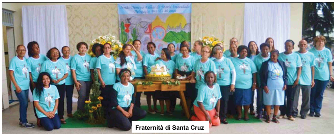
Fraternità di Santa Cruz