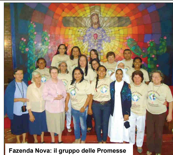
Fazenda Nova: il gruppo delle Promesse